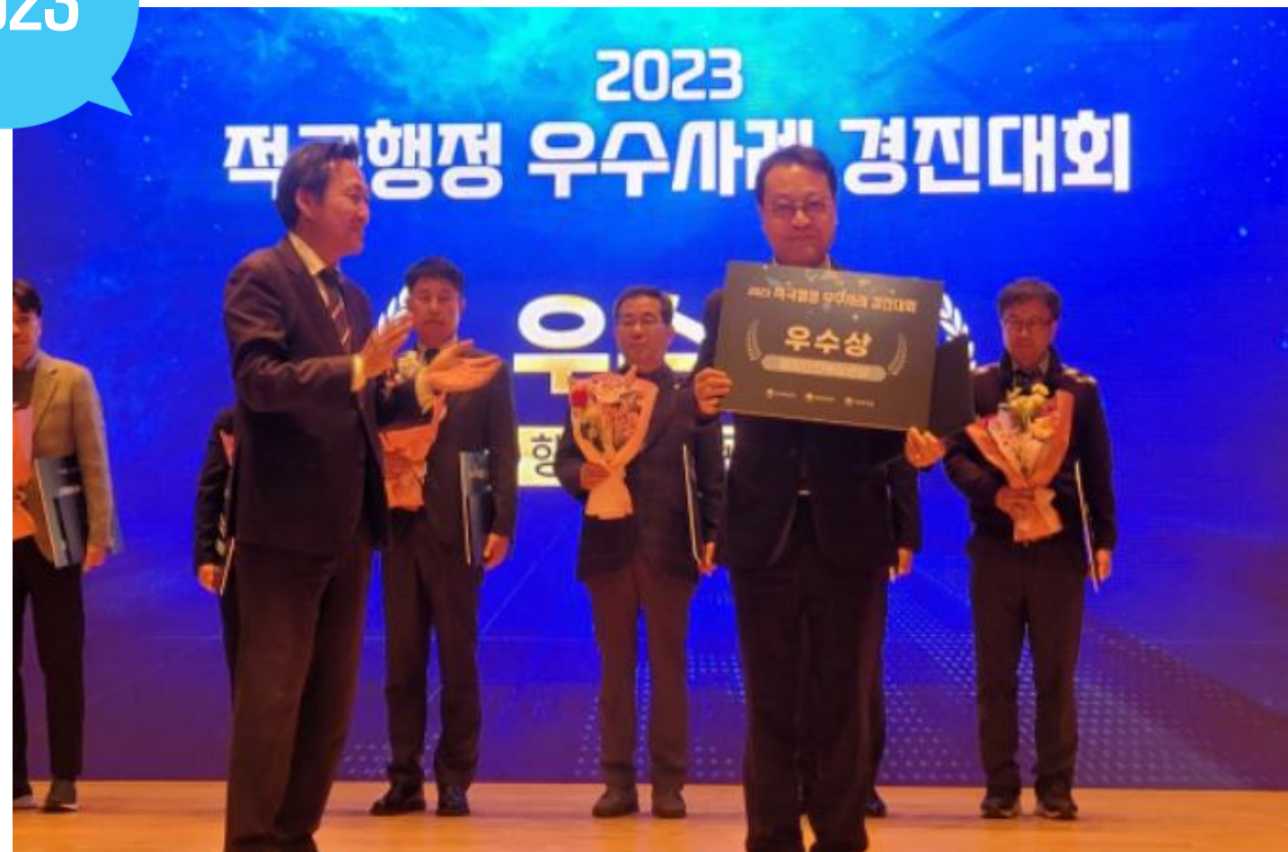
교통약자 프리패스 시스템