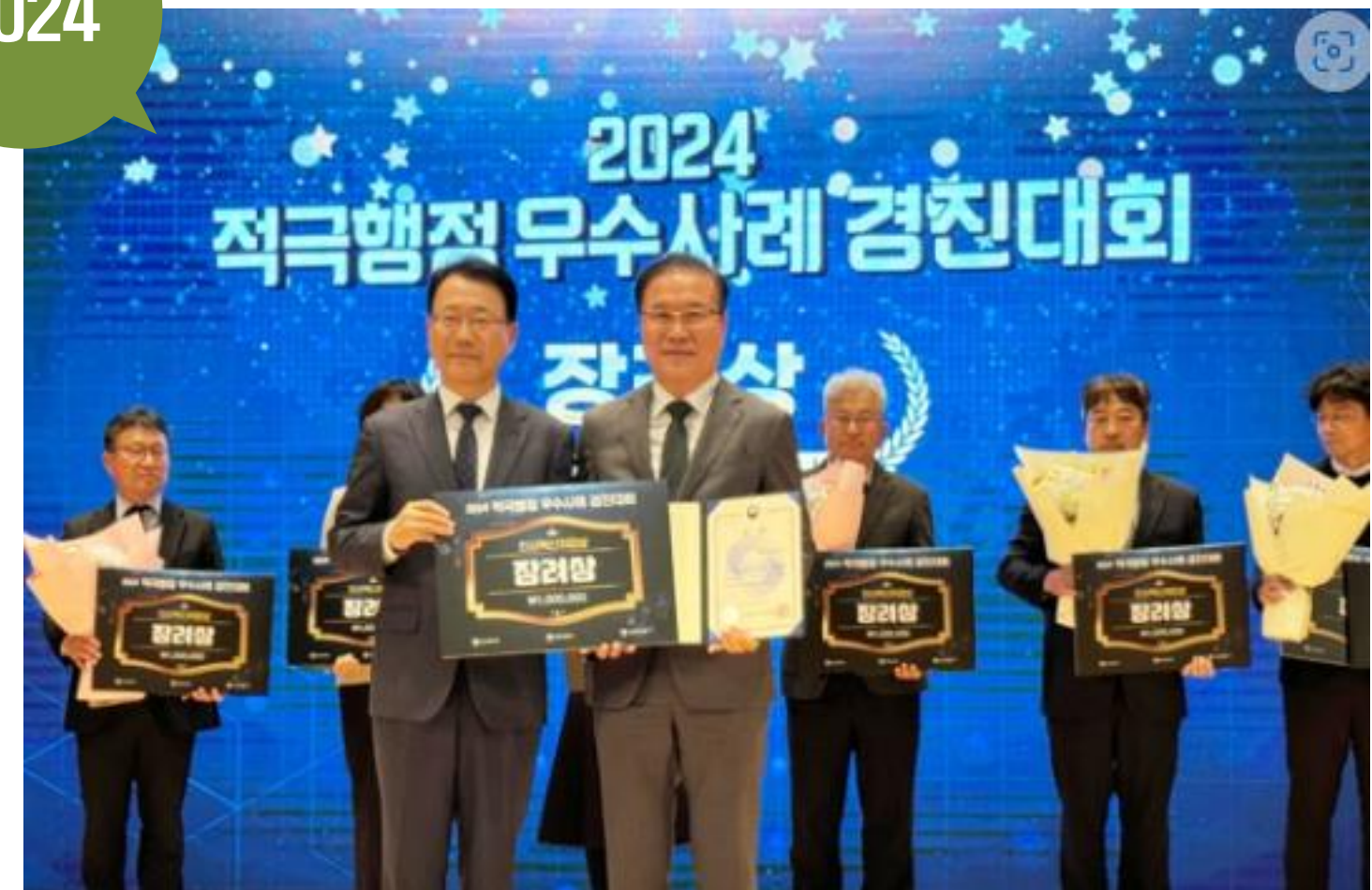
스마트 안심 화장실 구축